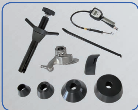
Amplia gama de accesorios