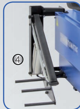
(1) Brazos auxiliares para un trabajo profesional (2) Manómetro cómodo (3) Eje central de sujeción con cono de ajuste (4) Elevador de ruedas para un trabajo rápido y cómodo