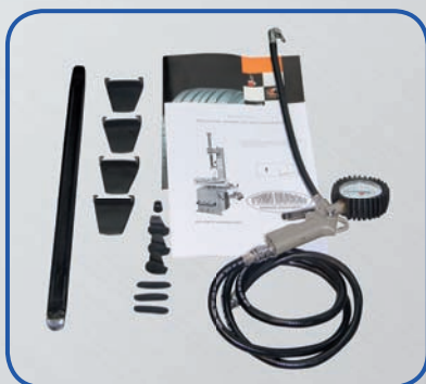
Amplia gama de accesorios