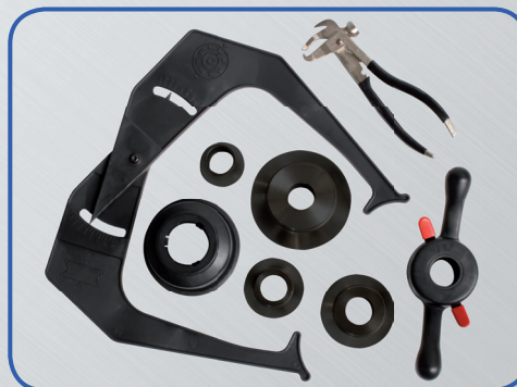
Amplia gama de accesorios