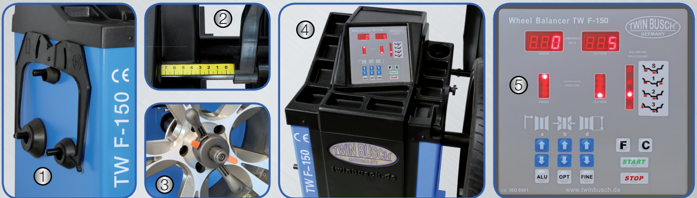
(1) Soportes laterales para conos de centrado y calibrador de llantas (2) Medición de distancia integrado (3) Tuerca de fijación rápida Ø = 36 mm (4) 11 compartimentos para las contrapesas (5) Display digital