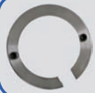
LLKW und Transporter-Adapter (Art.-Nr.: TW X-LLKW)