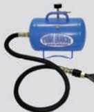
Luftbooster (Art.-Nr.: TW X-BOOST)