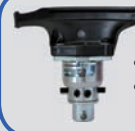
Schnell-wechsel-system (Art.-Nr.: TW X-SWS)