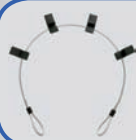
Wulstniederhalter KETTE (Art.-Nr.: TW X-KETTE)